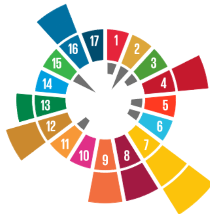
Figur 3. Målområden och hållbarhetssol för alternativet nytt sjukhus i Brunnsbög. Brustna hjärtan symboliserar att det finns konflikter mellan delmål, hela hjärtan att det finns synergier mellan delmål.