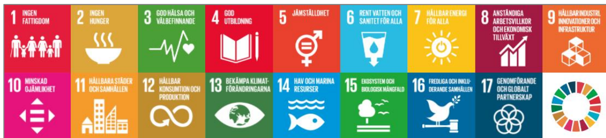
Figur 1 Ikonerna för FN:s 17 globala hållbarhetsmål

Swecos metod för hållbarhetsbedömningar utgår från delmålen under de 17 målområdena. Bedömningen görs av de delmål som är relevanta för sammanhanget.