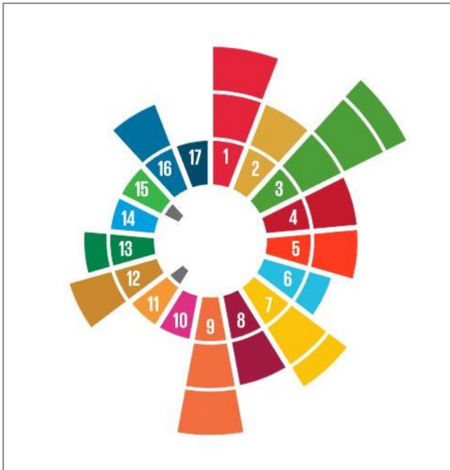
Figur 4. Manipulerad hållbarhetssol där de negativa värdena för två delmål inom målområde 3 tagits bort

Då det kan synas märkligt att ett ombyggt sjukhus skulle innebära negativa bidrag till målområdet God hälsa och välbefinnande , har en hållbarhetssol tagits fram vilken saknar de negativa värdena för delmål 3.6 och 3.9. Den manipulerade hållbarhetssolen visar då en positiv solstråle med värde 2,5 för målområde 3 God hälsa och välbefinnande .