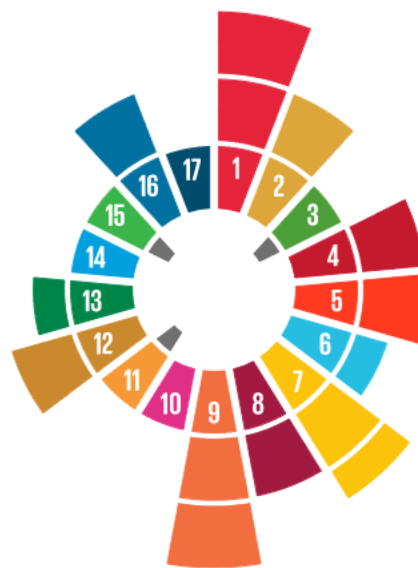
Figur 3. Målområden och hållbarhetssol för alternativet utbyggnad i befintligt läge. Brustna hjärtan symboliserar att det finns konflikter mellan delmål, hela hjärtan att det finns synergier mellan delmål.